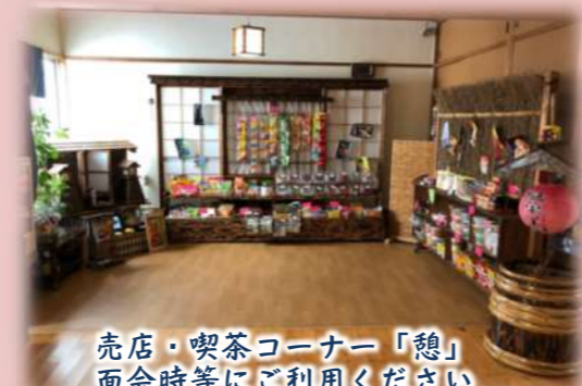
売店・喫茶コーナー「憩」面会時等にご利用ください