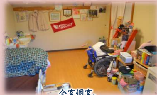
全室個室、なじみの家具をお持込みいただけます