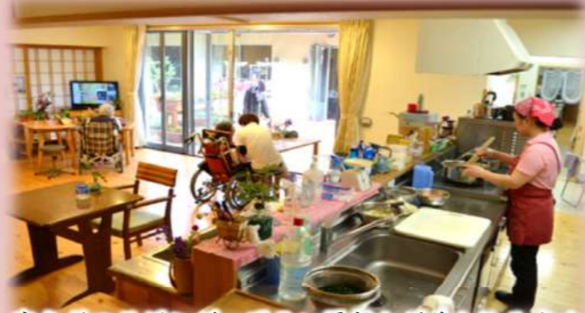
安らぎのリビング、明るい陽射しが差し込みます

龍生園では、「ユニットケア」を生活支援の方法として取り入れています。約10名単位の「ユニット(グループ)」を一軒の「家」として考えて、職員も家族の一員として固定し、入居者との「なじみの関係」を築けるようにしています。暮らしの面、そして食の面から支援させて頂き、「暮らしを支える」関わりの中で、龍生園が第二の我が家になるよう、支援いたします。